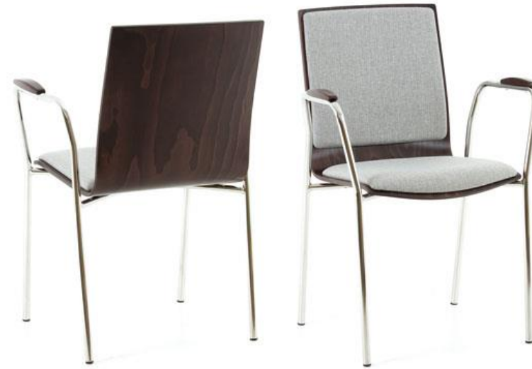
ZAM.BA de Lux