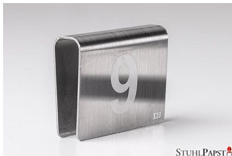
HAR.MONIE Nummerierung Klemme schmal