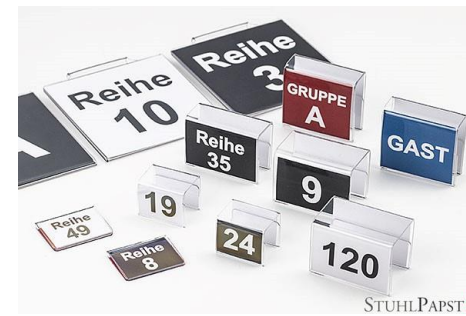
Reihennummerierung Klemme Klein