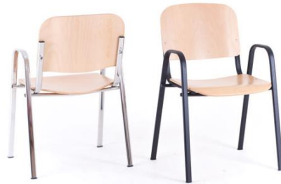
DIN ISO Holz AL